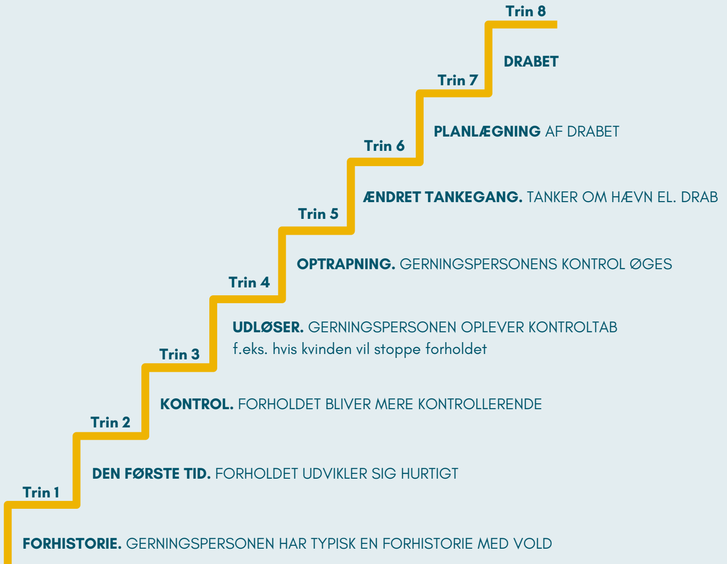
FIGUR 2: OTTETRINS MODEL FOR PARTNERDRAB PÅ KVINDER

Kilde: Monckton-Smith, J. (2020). Intimate Partner Femicide: using Foucauldian analysis to track an eight stage relationship progression to homicide. Violence Against Women , 26 (11). s. 1267-1285